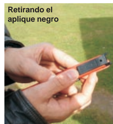
Retirando el aplique negro