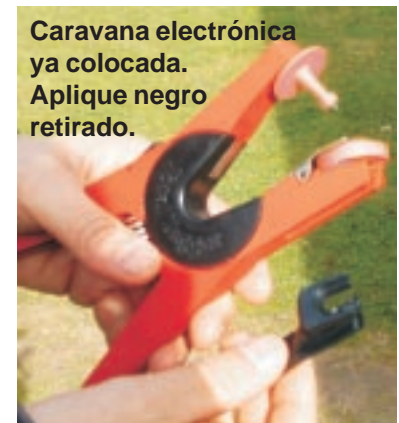
Caravana electrónica ya colocada. Aplique negro retirado.